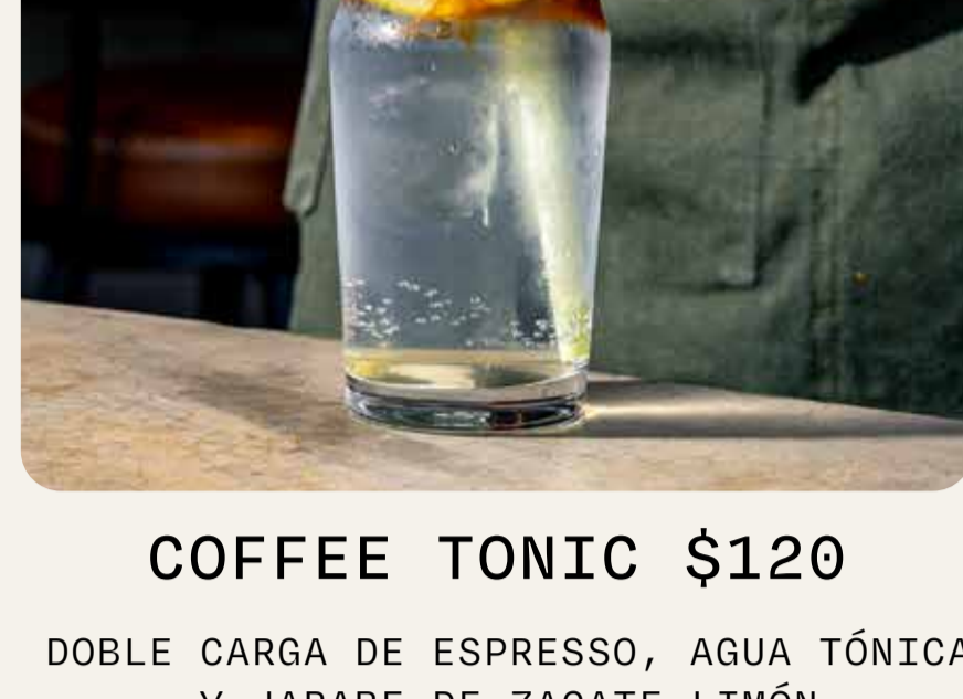
COFFEE TONIC $120

DOBLE CARGA DE ESPRESSO, AGUA TÓNICA Y JARABE DE ZACATE LIMÓN HECHO EN CASA.