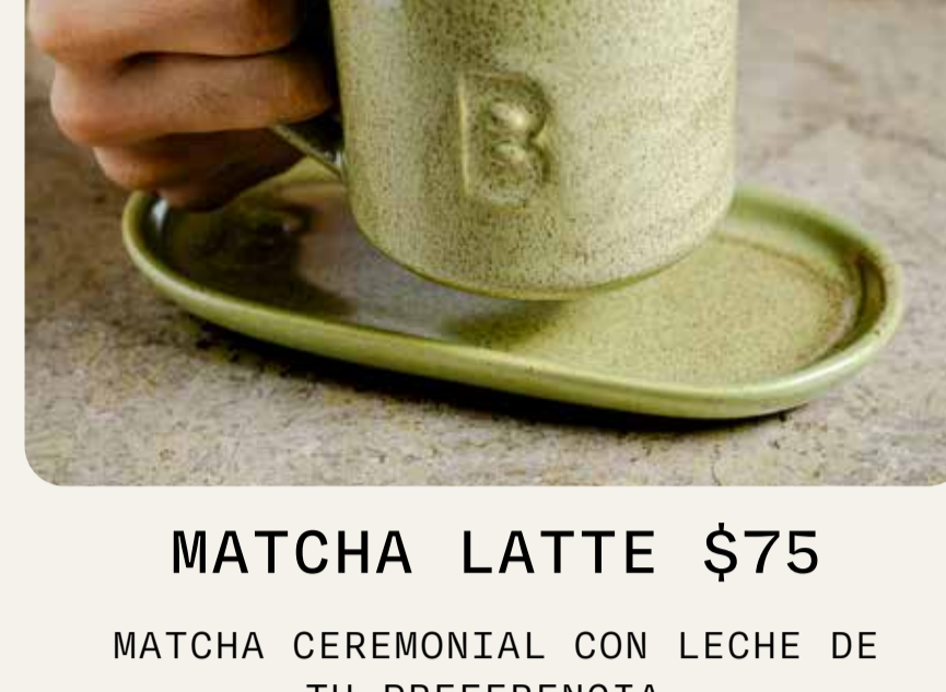
MATCHA LATTE $75

MATCHA CEREMONIAL CON LECHE DE TU PREFERENCIA.