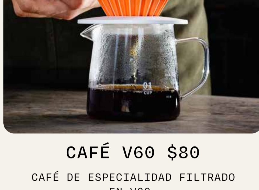
CAFÉ V60 $80

DOBLE CARGA DE ESPRESSO, AGUA TÓNICA Y JARABE DE ZACATE LIMÓN HECHO EN CASA.